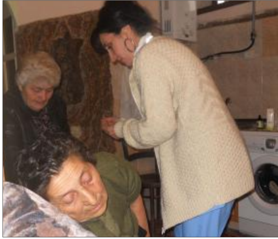
Վտարման ժամանակ ուշադրարժեք էր 84-ամյա տատիկը, որն ամուսնու հետ էր գնել Եշված տունը: