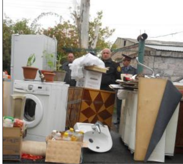
«Լավ ործանք». սոցիալադեմոկրատական կուսակցության գույքը փողոցում է: