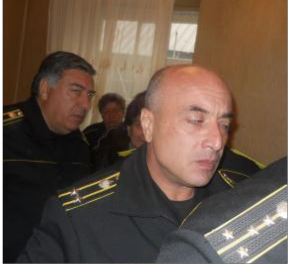
Ղախարակյան ակտերի հարկադիր կատարողները հարեւաններին էլ չեն լսում: