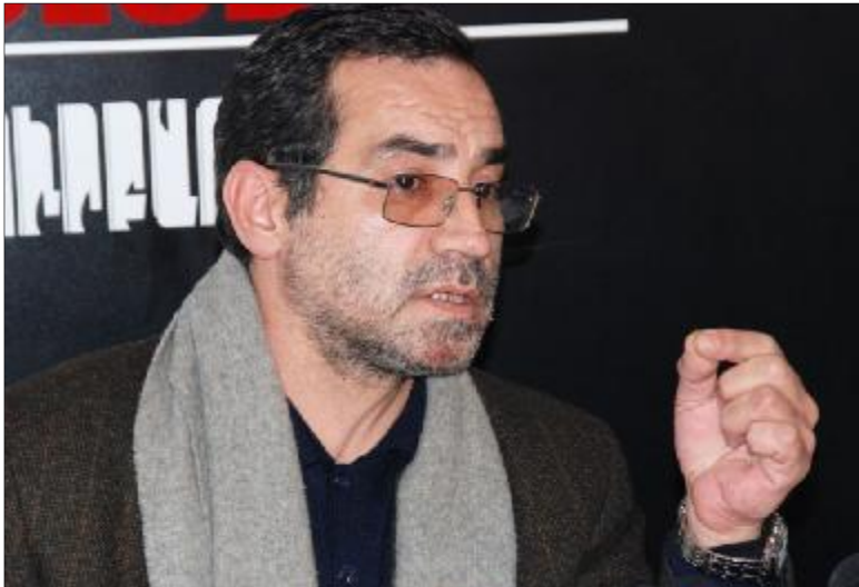
Ռեկտոր Արմեն Մազմանյանը կարծում է, որ բուհից դուրս յուրաքանչյուր ոք կարող է զբաղվել թե՛ կուսակցական, թե՛ սեռական քարոզչությամբ:

Օրերս կայացած ասուլիսում 49 նախարար Արմեն Աշոտյանն ասել էր, թե ընտրությունների նախաշեմին բուհերի ռեկտորներին խիստ քաղաքական հանձնարարականներ է տվել... Ըրանք դարձնելու են խստագույնս հետեւել իրենց ուսումնական հաստատություններում կուսակցությունների, կրթության եւ հանրակրթության մասին օրենքների կատարմանը: