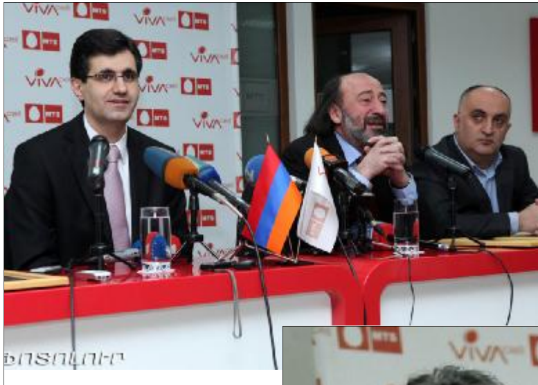
Ինքնաշարժը կոչ արեց բոլոր այն ռեժիսորներին, ովքեր նկարում են անգամ փոքր տեսախցիկներով, հեռախոսով եւ ինչով որտեղի՝ մասնակցել այս եւ հետագայում կազմակերպվելիք փառատոնին: «Կինոն ճարտիկ բաներ սիրում է, բայց այս անգամ ցուցաբերված ճարտարությունը՝ ինտերնետային քվեարկության ժամանակ արդար չէր, եղան մարդիկ, որ այդ ճանաչողարժեքով 15000-20000 ձայն հավաքեցին, հենց դրա համար էլ ստեղծեցինք յուրօրինակ ժյուրի»,- ասաց արձանագրեց նա:

«Ձարգացող աշխարհում անխուսափելի է ժամանակակից տեխնոլոգիաների ներթափանցումը նաեւ մշակույթի բնագավառում, ինչը ողջունելի է եւ խրախուսում է տաղանդի բացահայտմանը: Տեխնոլոգիական լուծումների կիրառումը, տվյալ դարազայում ինտերնետը ստեղծագործողին թույլ է տալիս առանց նյութական մեծ ռեսուրսների իր ստեղծագործությունը հասցնել լայն հասարակությանը: Չափազանց կարեւոր