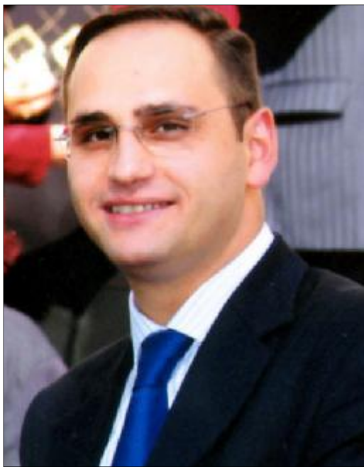
Քաղաքական առողջ մրցակցություն:

Եւ նկատի ունեն նաեւ ընտրությունների օրինականության հետ կապված հարցի շուրջ համամայնությունը, որն առկա է ընդդիմադիր դաշտում: Շատ լավ է, որ կա այդպիսի համայնքում խաղի կանոններ սահմանելու շուրջ, որի տարազայուն ենթադրվում է նաեւ