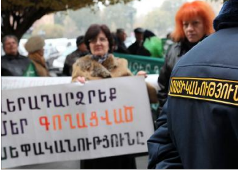
տեղեկացնում ենք Ձեզ, որ դեռևս չենք շինարարության սկզբից, կատարելով լայնածավալ աշխատանքները, ըստ ժամանակացույցի, գումարներ ենք ներդրել շինարարության համար: Երբ չենք կառուցվեց, բնակարանների տերերը տեսան, որ իրենցից բացի՝ կան նաև այլ տերեր: Գործին խառնվեց ԴՅ

Իսկ նրա հյուսած սարդոստայնի մեջ տասնյակ բնակիչներ են հայտնվել, որոնք ոչ մի կերպ չեն կարողանում ստանալ իրենց բնակարանները: