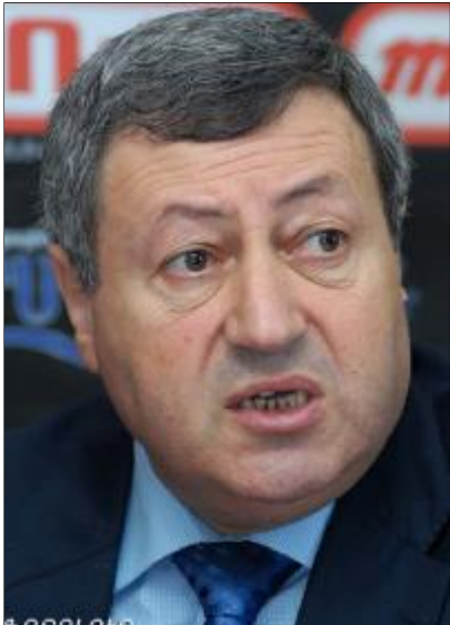
Կարտադրվի եւ կիջեցվի մի ինքնարժեքը:

Ուժը իսկ խախտվում են սղառողի իրավունքները, եւ ոլորտում ստեղծում են ոչ միայն անհավասար դրամայիններ, ինչն էլ, բնականաբար, մտահոգելու տեղիք է տալիս: Ես կարծում եմ, որ հակամեծաշնորհային հանձնաժողովը ղեկավարելու լուրջ ուսումնասիրման ու բճարկման առարկա դարձնի թռչնի մսի շուկայում ստեղծված իրավիճակը: Տեղական թռչնի միջ կազմում է սղառման մոտ 25 տոկոսը: Ինչու ենք մենք Հայրենական ամրանք արտադրողների միությունը, շահագրգռված, որոշեցի տեղական թռչնի միջ 2-ատ արտադրվի եւ իրացվի, որովհետեւ դա կխթանի մեր աշխատատեղերի ավելացմանը եւ կադրային սղառողներին թարմ ու որակյալ մսի մատակարարումը: Մենք չգիտենք, թե որտեղ սայլ թռչունները ինչպես են աճեցվում, ինչպիսիք են ներմուծված մսի որակական հատկությունները: Ու քանի որ դա հայտնի չէ, միշտ էլ կասկածելու տեղիք է տալիս: Դրա համար կարծում եմ, որ կատարյալապես ղեկավարողները պայքարեն իրենց հետ չի հարաբերվում: Տեղական թռչնամսի ինքնարժեքը 1100-1200 դրամի սահմաններում է: Լեռնավանդի մաքսագերծման գինը 300-400 դրամ է, մի այդպեւ էլ գինը է լինում, ստացվում է, որ ներմուծված թռչնի մսի արժեքը լինում է մոտ 800 դրամի սահմաններում: Ինչը խիստ տարօրինակ է: Եվ այն, որ ներկրված թռչնի ստեղծված միջ, ըստ թռչնաբույծների, նաեւ հալվելով, վերամշակված, վերափայտեթավորվում է ու տեղական թարմ մսի տեղ վաճառվում, դրա-