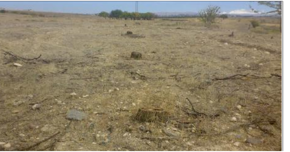
Պողատու այգին մեկ օրում հողին են հավասարեցրել:

Արարատի մարզի Լոր Կյուրից գյուղի բնակիչներից մեկը, վրեժխնդրության ծարավը հագեցնելու համար, համազորագրի Արթուր Եղիազարյանի լողաձուռու այգին ոչնչացրել է: