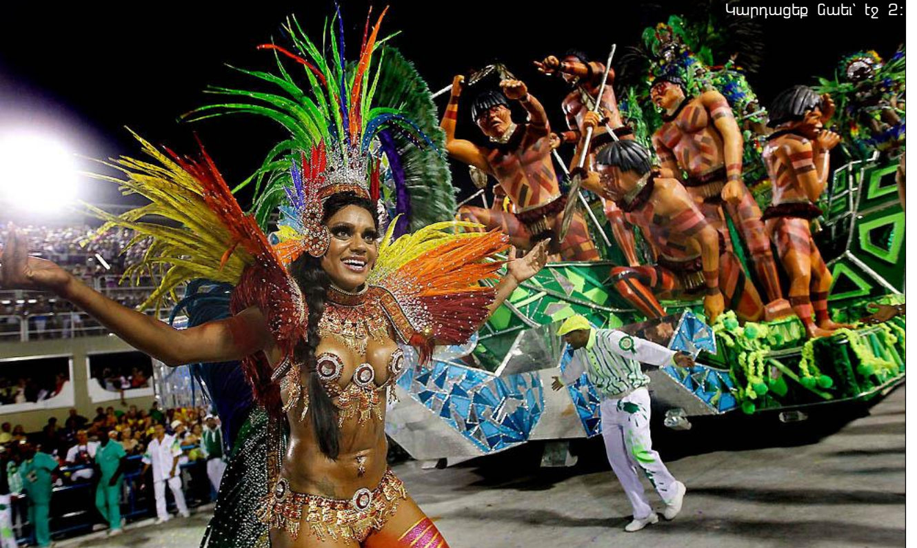
Կարդացեք նաև՝ էջ 2:

Գյումրու քաղաքապետ Վարդան Ղուկասյանը 5 հինգ օր է 9 հոգանոց ղախկրակությամբ բրազիլիայում է կամ, ինչպես կասեին գյումրեցիները, Ռիոյի կանոնավարում է: Այս փաստը տարբեր քննարկումների է արժանացել Facebook-ի «Լեճնագանցիք» խմբում: Օգտատերերից շատերին հետաքրքրել է, թե ովքեր են ղախկրակության կազմում և ինչ միջոցներով են այդ թանկարժեք ճանապարհորդությունը կազմակերպել: Խմբի անդամներից մեկը, դիմելով լրագրողներին, գրել էր. «Հարգելի լրագրողներ, ձեզ տեսնեմ, կարո՞ղ եք դարձել իմ հարցերի ղախկրակությունները. կա՞ նրանց մեջ զոհե մի տարող, զոհե քաղաքապետարանում տարադեմ էն սամբա, թե՞ ղիտի գնան խայտառակվեց: 2-րդ հարց՝ ի՞նչ գումար է ծախսվել, և 3-րդ՝ այդ գումարով ի՞նչ կարող էին անել Լեճնագանում»: Մեկ այլ օգտատեր էլ հունդով հավելել էր. «Գյումրեցիներ, մի քիչ համբերեք, քաղաքապետը Ռիոյի հարցերը լուծե, գուցա փողոցների սառույցը կմաքրե»: