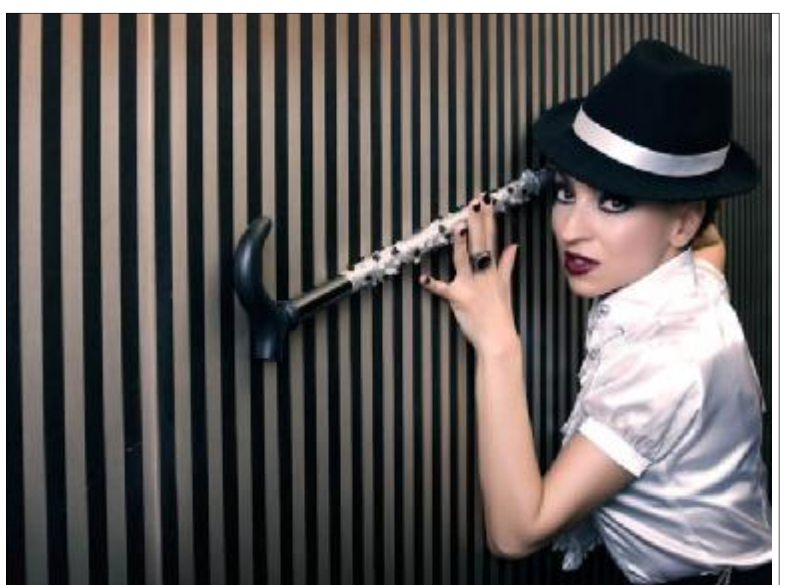
Երգչուհի Juice-ը մեծ դա ինչը դա ինչը:

Քառասուցորյա դա ինչը հաջորդում է դա ինչը ևս մեկ շաբաթ շրջան՝ Ավագ շաբաթը: Այդ է լուրջ քննարկում, որ քառասուցորյա կոչվող դա ինչը 48 օր է տեսում: Մեծ դա ինչը ունի յոթ կիրակի՝ Բուն Բարեկենդան, Արտաքսում, Անտակի, Տնտեսի, Դատարի,