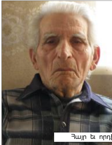
Հայր եւ որդի

93-ամյա հայրը դաժանաբան է բացահայտել որդու անհայտացումը ու սղանությունը, ինչը մինչ օրս մնում է չբացահայտված: