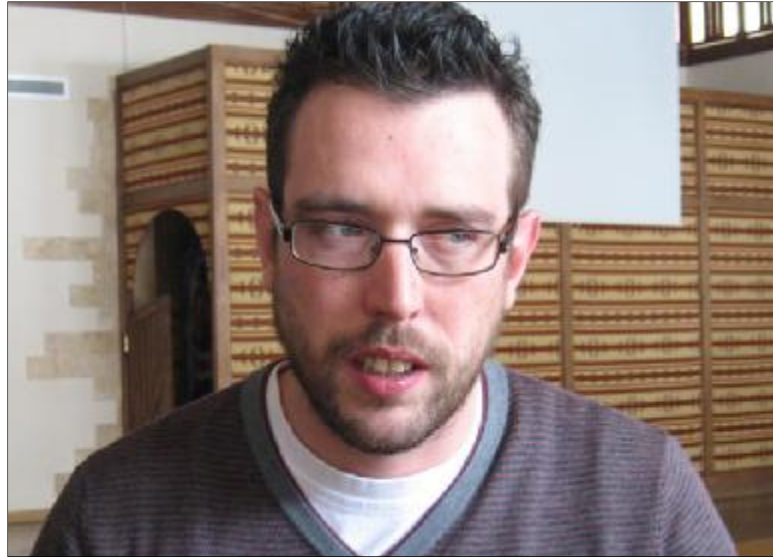
Նա նշում է, որ ֆեդերացիայում լրագրողների դեմ գրանցված բռնությունները տարբեր բնույթի են՝ ծեծ, նկարահանելու արգելք, ստալոնայիք, վիրավորանք, անտանգում, սղանություն, դանակահարություն, անհայտացում, ձերբակալում, կալանք, ճնշումներ,

ահաբեկում, տեղեկատվության ազատության սահմանափակումներ, անազնիվ մեղադրումներ և այլն: