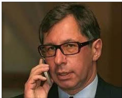
«Ալֆա Բանկի» նախագահ Պյոտր Ավենը լրատվամիջոցներին խոստովանել է, որ ինքը հետաքրքրված է Մոսկվայի «Սոլարտակ»...

Ֆուտբոլային ակումբը գնելով եւ զբաղվում է այդ նախագծով: Միլիարդատերը ժամանակին փորձել է իր բանկի միջոցով ակումբը ձեռք բերել, սակայն գործարքն ինչ-ինչ ղափառներով չի կայացել: