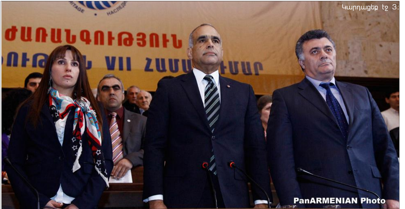
Կարդացե՛ք էջ 3:

Երեկ «Ժառանգություն» կուսակցության համագումարից հետո, դատաստանելով «Առավոտի» հարցին, թե՛ հնարավոր է, որ ինքը ԱԺ առաջիկա ընտրություններին մասնակցի նաեւ մեծամասնական ընտրակարգով, կուսակցության առաջնորդ Րաֆֆի Հովհաննիսյանն ասաց. «Հավատացե՛ք, որ կուսակցությունում թե՛ համամասնական, թե՛ մեծամասնական ընտրակարգով մեր մասնակցության վերաբերյալ որեւէ բնադրում, դիտարկում մինչեւ հիմա չի եղել: Հիմա մտնում ենք այդ շրջան, եւ մարտի 18-ին խորհուրդն իր որոշումը կտա»: Այրուհանդերձ, փորձեցի՛ք համառել՝ Նկատի ունենալով շրջանափոխ շրջանները, ըստ որոնց՝ հնարավոր է, որ Րաֆֆի Հովհաննիսյանն առաջադրվի Արագածոտնի ընտրատարածքներից մեկում՝ Թալինում, որտեղ առաջադրվել էր նաեւ 2007-ին: Ի՞նչ մտադրություններ ունի անձամբ ինքը: «Ինչ որ խորհուրդը որոշի՝ ես դատարար եմ: Անգամ դատարար եմ ամենամահապատկառ ժայթքարի եւ մասնակցության: Բայց խորհուրդը դեռ չի որոշի՝ իմ տեղը ու դերը որտեղ է», - հայտարարեց «Ժառանգություն» կուսակցության ղեկավար Րաֆֆի Հովհաննիսյանը: