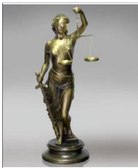
Իսկ այդ վիրահատությունների և ամբուլատոր բուժման ծախսերը հոգացել է ինքը՝ դատարանը:

Լիանա Գրիգորյանը նաև է ուղարկել նաև արդարադատության նախարարին՝ նրան տեղեկացնելով, որ տարել է երկու ծանր վիրահատություն: