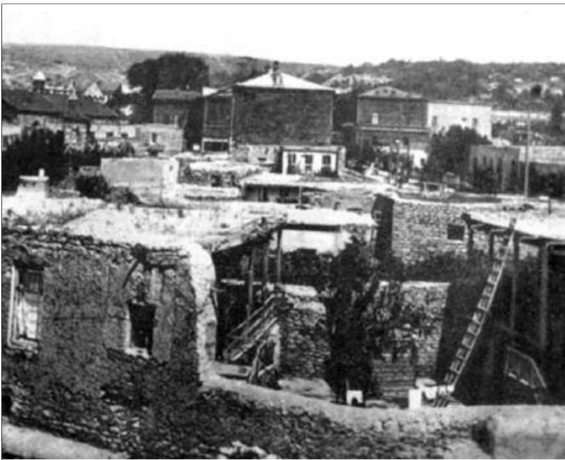
Տեսարան՝ Հին Երեւանից:

ՀՀ մշակույթի նախարարության ղափտմանը ու մշակույթի հուշարձանների ղափտմանը գործակալության երեւանի տարածքային բաժնի ղեկավար Այվազյանի եւ գործակալության ղեկավար Սերժիկ Առաքելյանի հեռախոսները երեկ «շտապախոսեցին»: «Հասնիկ» էր միայն գործակալության ղեկավարը, որը կապվել էր Սասնիկ Մուսայանը: Հարցրինք՝ ի՞նչ որոշումներ նկատի ունեն