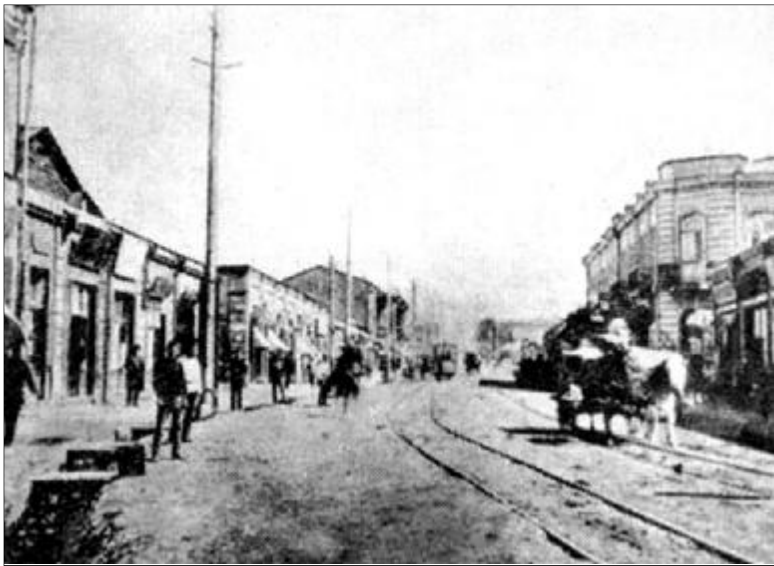
Նախկին Աստաֆյան փողոցը:

Lragir.am ում օրերս տեղ գտած «Հասնիկ Պողոսյանն էլ ղափտման հայ չէ» նյութից տեղեկանում ենք, որ ՀՀ մշակույթի նախարարը փակ շուկայի խնդրի շուրջ խոսելիս հայտարարել է. «Այն, ինչ անհամաձայն է երեւանում, այդ որոշումները կայացվել են 2004 թվականին: Հուշարձանի աղանդականության, բանդան, վերացման որեւէ որոշում, եւ ամենայն դեպքում եւս, կառավարությունը չի ընդունել: Սխալ մեկնաբանություններ են եղել, չկա նման բան: Կան այդ որոշումների հետեւանքները, այսինքն՝ երբ որոշումներն ընդունվել են, սակայն ի կատար չեն անվել, գործընթացը տեղափոխվել է 7-8 տարի հետո, եւ