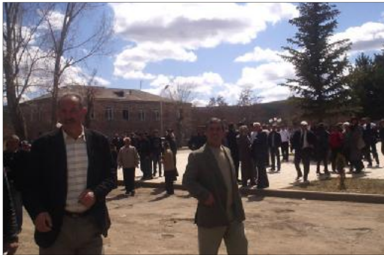
Մարալիկցիները դարձան ԿԻՊ, որը համար էլ եկել էին լսելու, թե ով ինչ է ասում:

ՀՀԳ-ի կազմակերպիչ փրկել կործանվող ճարգերը