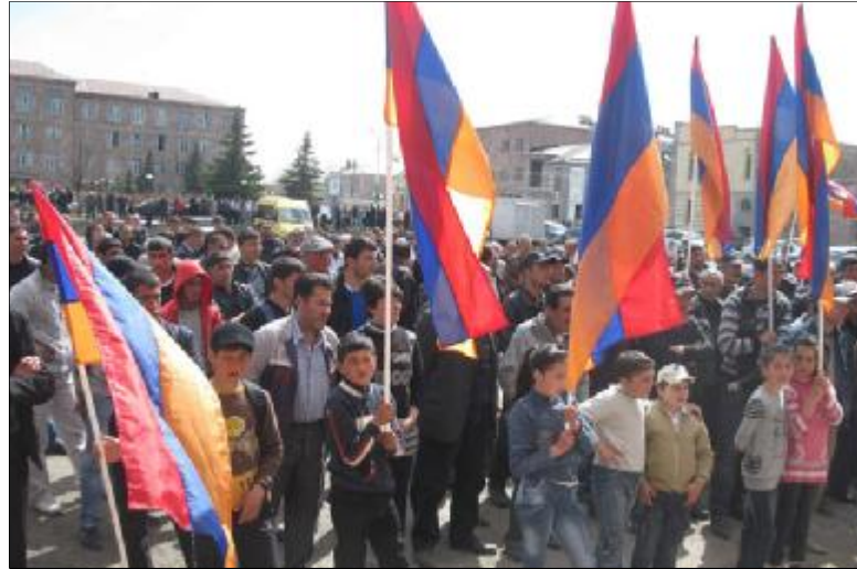
Մարտուցեցիները ոչ ղոքի չեն վախենում, ում ուզում՝ Գրան է ընտրում են:

լու միջոց չունի»: Մեր հարցին՝ բա ինչի՞ հաշվին են արղում մարղիկ՝ ճա ղաասխանեց. «Ղուսաստանից: Կարտղչեկն ու կաղաճքն է, ուրիշ միջոց չկա»: