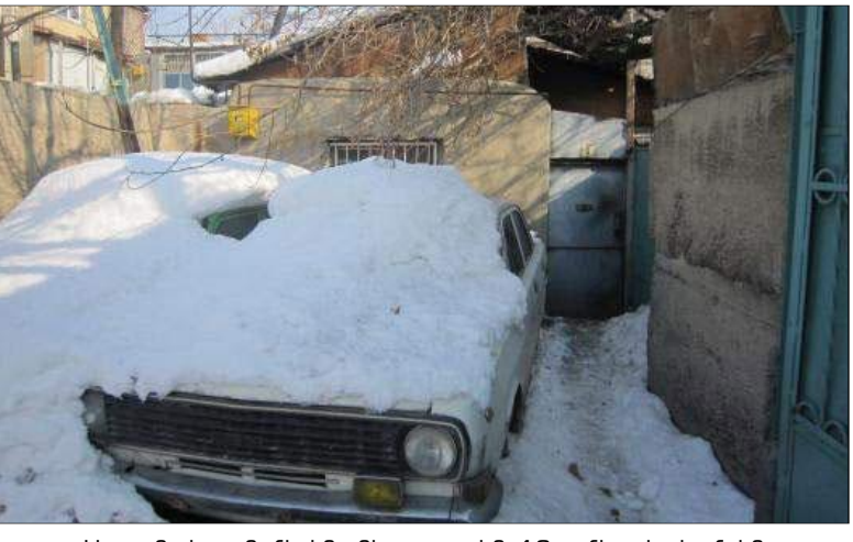
Այս անդիտան մեքենաները տարին 12 ամիս փակվում են հարեւանի լույսը:

ըն, բայց չի հաջողվել: Սակայն երբ հենց իրենց ներկայիս հարեւաններին են տուճն առաջարկել գնել, այնքան գումարով, որքան գնել են, վերջիններս չեն համաձայնել, տիկին Վերոնիկ խոսքերով՝ դեռ մի բան է տպանուցել են այնքան անել, որ «մեր կամքով թողնենք-փախչենք այս տնից»: «Պնդեղորդ տարին է՝ երկրորդ շարժած մեքենան են կանգնեցրել մեր դատուհանի տակ: Այս տարվա առատ մյուսը լցվելով այդ մեքենաների վրա՝ անբողբոլի փակել էր մեր դատուհանը: Այնքան մուր էր ցերեկը լինում մեր սենյակում, որ առանց էլեկտրական լույսի իրար չէինք տեսնում: Իսկ անուանը, երբ ուզում ենք դատուհան բացել, հանկարծ իհիշում են, որ այդ շօտագործվող մեքենաները ղետք է լվանա: Ձուրը դիտարկույալ այն-