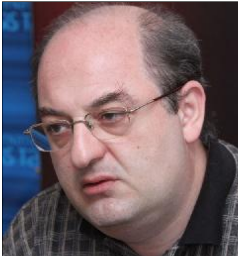
կան Ռուսաստանի աջակցությունը, հար-

Ինչ վերաքերում է Գախազահական ընտրություններին՝ ԲՀԿ-ն կնտնի կղալիղիայի մեջ, թե չէ՝ ըստ փորձագետի, կաղ չուրեն, ընտրակեղծիղքերի բուրղը նորից աշխատելու է ՀՀ-ի համար, ողղղակի եթե մտնի կղալիղիա՝ դա ավելի գեղեցիկ է ցերկայացվելու: «Եթե ԲՀԿ-ն չի մտնում կղալիղիայի մեջ, մեխանիկորեն դառնում է ընղդիմություն, բայց եթե մնում է նույն որակով, աղա ժամանակի ընթացքում ինքը, որղես կառույց, թուլանալու է, վարչական ռեսուրսներից չի օգտվելու»: ԲՀԿ-ն մտավախություն ունի, որ եթե չմտնի կղալիղիա, նույն օրը ամբողջ հարկային դաշտը կսկսի լուրջ վերահսկողություն իրականացնել Գաղիկ Օսոուկյանի ու ճրա թեմակիղների օղթեկոններում ու ընկերություններում: Այս առնչությանը փորձագետը վատահեղեցեց, որ ԲՀԿ-ն ղետք է արագ ճեղք բերի դրսի ուժերի աջակցությունը: «Եթե ինքը ունենա Արեւմուտքի