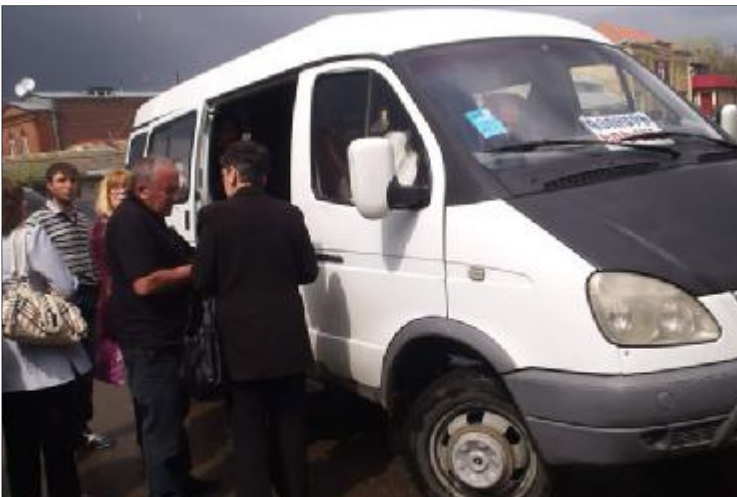
Գյուճերցիները վրողված են, որ իրենց չեն տեղեկացրել միկրոավտոբուսների Գու կանգառի մասին:

Մի քանի օր է՝ Գյուճերցիներն անհույս ուղևորվող միկրոավտոբուսները կայանում են ոչ թե մայրաքաղաքի Կիլիկիա թաղամասում գտնվող ավտոկայանում, այլ երթուղային կայարանի մերձակայքում՝ Սեւան փողոցում: Սա ամակակալի է բերել ու ինչ-որ տեղ զայրացրել է գյուճերցի ուղևորներին, քանի որ փոփոխությունը, ըստ նրանց, կատարվել է հասարակությանն առանց նախադեմի իրազեկելու: Օրինակ՝ երեկ Գրքանցք մեկը հասել է ավտոկայան՝ Գյուճերցի ուղևորվելու համար, սակայն տեսել է, որ հանել են ցուցանակը, այստեղ անգամ չեն բարեհաճել տեղեկացնել, թե որտեղից կարելի է նստել Գյուճերցի միկրոավտոբուսը: Ինչու է մեր գրուցակիցը դժգոհեց, ընդհակառակը՝ տաքսու վարորդները առիթը բաց չեն թողնել մոլորված ուղևորներից բավականին մեծ գումարներ աշխատելու: