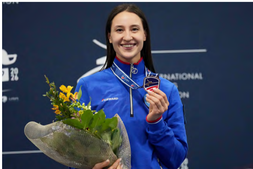
Yana Egorian médaille d'or à Séoul

La Russe Yana Egorian garde son statut de l'une des meilleures sabreuses du monde en