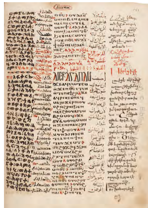
Le psautier égyptien