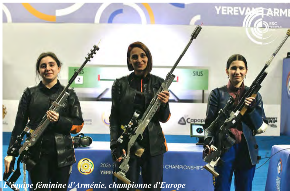
L'équipe féminine d'Arménie, championne d'Europe

Les championnats d'Europe de tir à 10 mètres se sont déroulés à Erevan du 27 février au 5 mars, au cours desquels l'Arménie a pris la 2 e place au nombre de médailles (11 : 4 en or et 7 en argent) derrière l'Ukraine (14) et devant l'Allemagne (10),