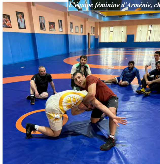
Stage à Erevan

elle a organisé la même formation, mais axée sur la lutte libre. Cette formation d'entraîneurs s'est déroulée du 10 au 14 avril à Erevan. Parallèlement, une formation de base pour l'arbitrage a eu lieu du 14 au 17 avril. Ces deux formations ont été organisées en partenariat avec la Solidarité Olympique, le CNO